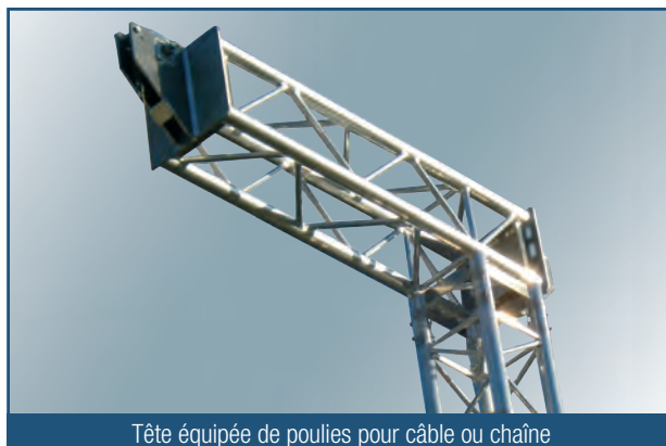
Tête équipée de poulies pour câble ou chaîne