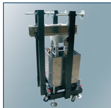
Ensemble optimisé pour le transport