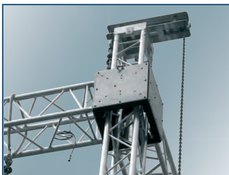
Chariot acier / aluminium renforcé