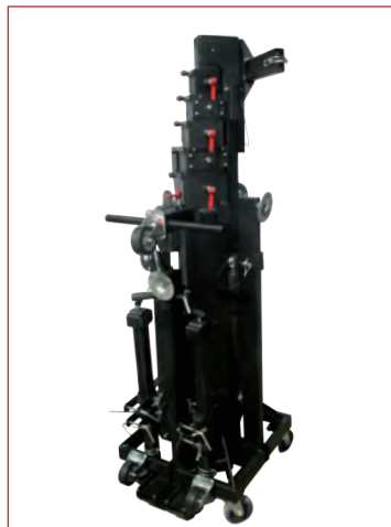
Position repliée (transport vertical)

L'ALT 700 est conçu pour monter des charges verticalement. Son système de chariot lui permet le chargement latéral ou frontal de la structure à 57 cm du sol. Il est équipé de rattrapage de jeux, de poulies, avec roulement à billes autolubrifié et d'un treuil auto-freiné surdimensionné pour limiter les efforts dans la manivelle. Avec une hauteur de seulement 1,90 m. replié permettant le transport dans tous les types de camion, il sera le produit incontournable des professionnels de l'éclairage.