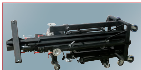
Position transport couchée