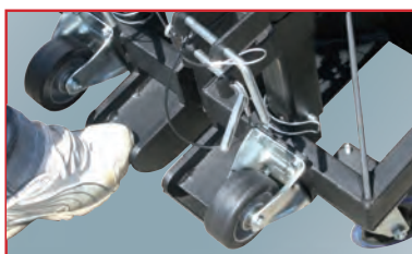
Sabot facilitant le basculement du pied