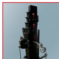
Poignée en position pour pied en mode travail