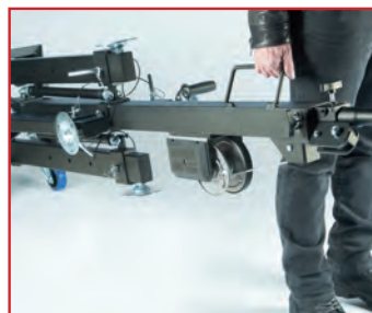
Position transport couché