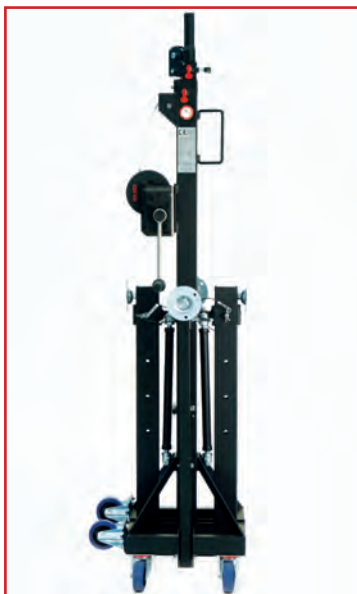
Position repliée (transport vertical)

Conçu dans le même esprit que l'ALT 550, l'ALT 470 est destiné à des prestations moins importantes. Il bénéficie d'une finition peinture époxy noire anti-reflet et d'un traitement électrozingué noir. Il dispose d'un système de sécurité et de suppression de jeu dans les mâts. Son treuil anti-retour auto-freiné est équipé d'un frein à friction. Une coupelle d'appui permet la fixation au sol.