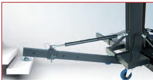
4 pattes indépendantes montées sur vérin