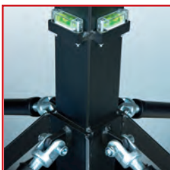
2 niveaux à vue pour mise à l'aplomb