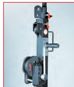
Treuil anti-retour freiné