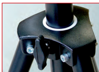
Chariot en aluminium coulé avec molette de serrage sur cale polyamide et bague téflon