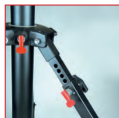
Patte réglable pour terrain accidenté