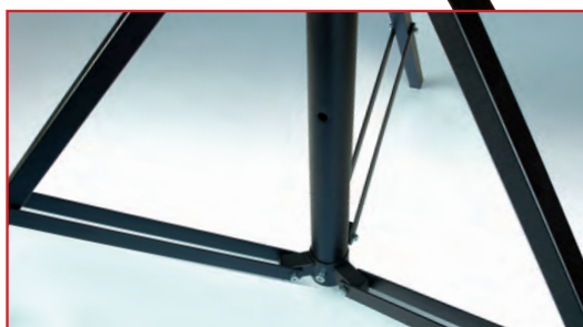
Pattes à double traverse