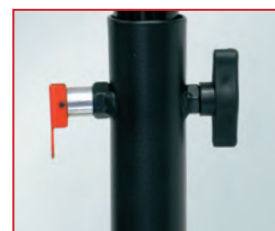
Molette de rattrapage de jeu et mât embouti pour un guidage parfait et goupille de sécurité