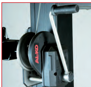
Treuil anti-retour freiné