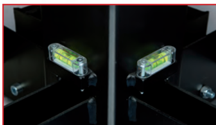
2 niveaux à vue pour mise à l'aplomb