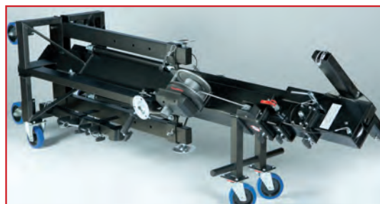
Position transport couchée