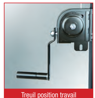
Treuil position travail