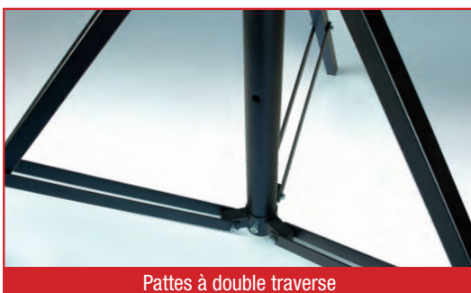
Pattes à double traverse