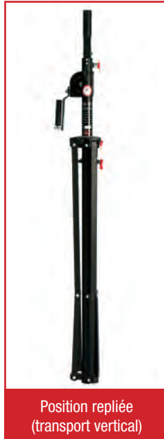
Position repliée (transport vertical)