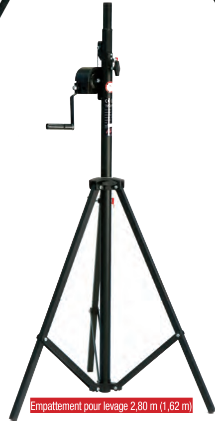
Empattement pour levage 2,80 m (1,62 m)