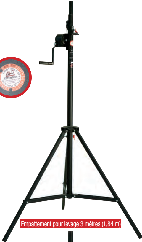
Empattement pour levage 3 mètres (1,84 m)