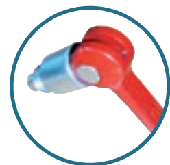
Nouvelle goupille de sécurité

L'ALT 600 est conçu pour monter des charges verticalement. Son système de chariot lui permet de charger la structure à 40 cm du sol. Il est équipé de rattrapage de jeux, de poulies sur roulement à billes autolubrifiées et d'un treuil auto-freiné. Il sera le produit incontournable des professionnels de l'éclairage.